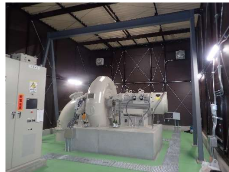
発電所内（水車発電機）