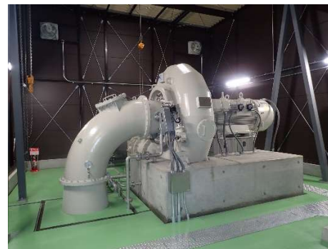
発電所内（水車発電機）